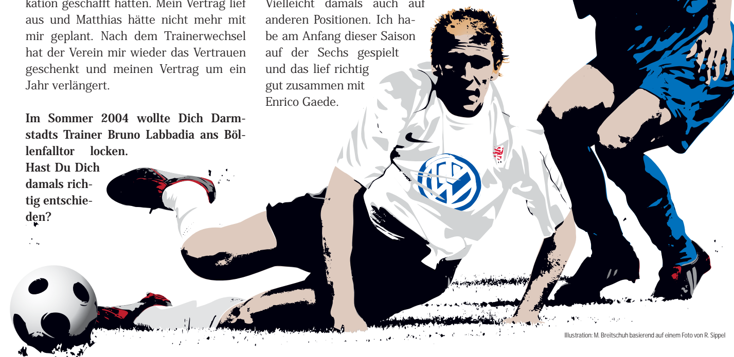
Illustration: M. Breitschuh basierend auf einem Foto von R. Sippel

Hast Du Dich damals richtig entschieden?